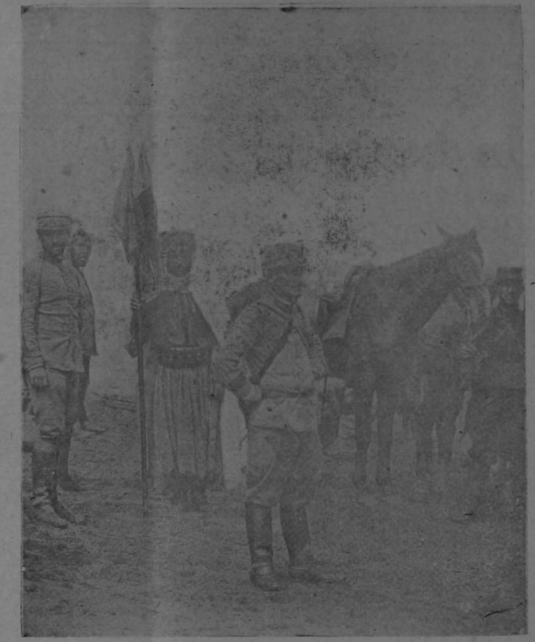
El grabado representa al Coronel Enlhard, uno de los jefes más activos de la invasión francesa en Marruecos. A su acometividad y entusiasmo se debe en gran parte el resuelto avance de Francia en el Imperio Marroquí.